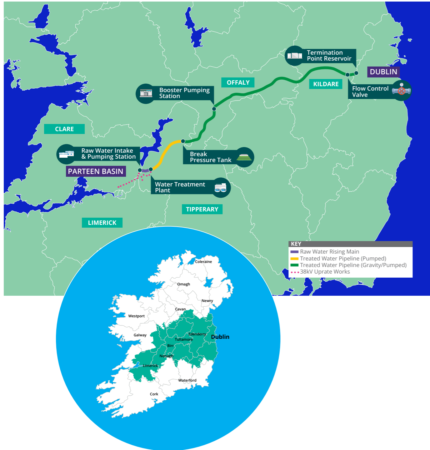
Water Supply Area that the Proposed Project provides the capacity to supply